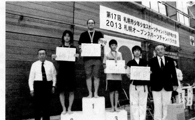
※指定以外の使用と用具の貸借は禁止する。規定のエアソフトとする。